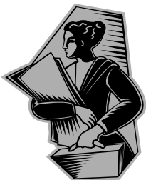
Английский язык для иностранцев

Люди изучающие английский язык— это студенты, вышедшие из семей, в которых, в основном разговаривали не на английском, а на других языках. Такие студенты могут быть иммигрантами из разных стран. Некоторые студенты, родившиеся в Америке, также выходцы из семей, в которых не говорят по-английски.