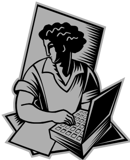
Аттестат о среднем образовании

Занятия один на один — студенты и наставники встречаются в библиотеке раз в неделю на двухчасовой класс.